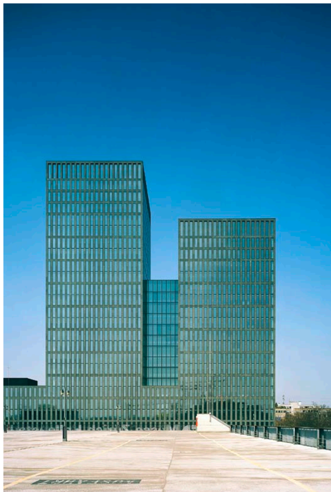
Die zwei Hochhäuser an der Hagenholzstrasse in Zürich verfügen über eine Abluffassade. Sie zählen zu den bekanntesten Minergie-Neubauten der Schweiz.

Die speziellen Brandschutzanforderungen in den unterirdischen Archivgeschossen mit konstanter Temperatur und Luftfeuchtigkeit führten zu einem engen Zusammenspiel zwischen Bau- und Gebäudetechnik: Die einzelnen Archivräume wurden konstruktiv so weit unterteilt, dass keine spezielle Entrauchungslüftung eingebaut werden musste. In einem Brandfall würde die normale Lüftungsanlage ausreichen, um ein Kompartiment zu entrauchen. Mit ein und derselben Lüftungsanlage kann somit Frischluft zugeführt, Baufeuchte abgeführt, zu trockene Räume befeuchtet, die Raumtemperatur mittels gekühlter oder erwärmter Luft reguliert und im Brandfall entraucht werden. Um die Lüftung möglichst energiesparend zu betreiben, wird sie auf Umluft geschaltet, solange sich in den Räumen kei-