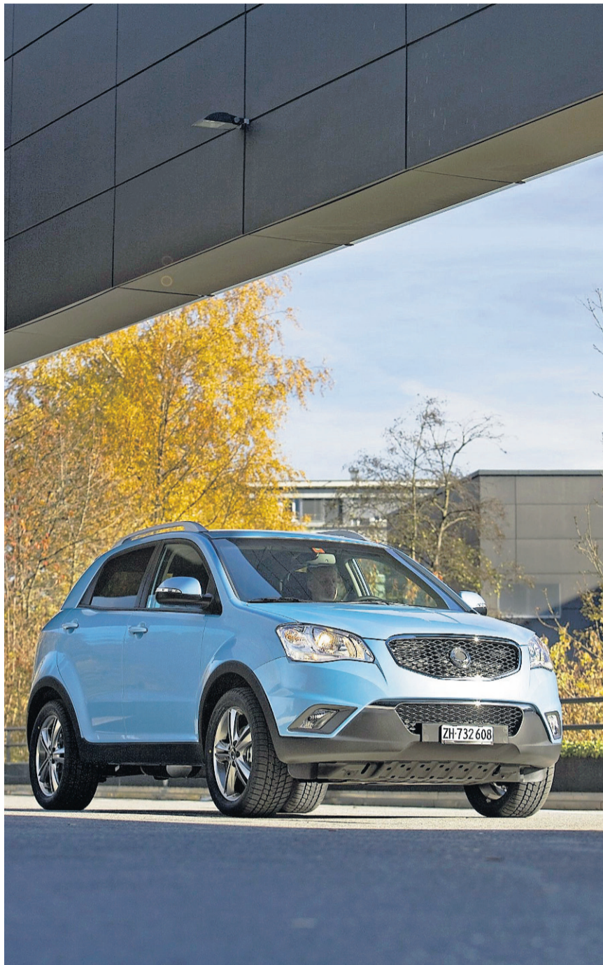
Das Design trifft den Geschmack der europäischen Kundschaft.