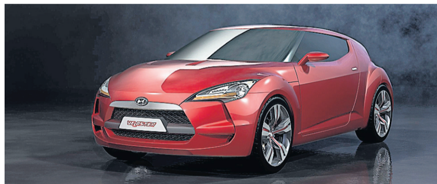
Das neue Coupé sieht aus wie die Studie «Veloster». HO

4,22 Meter lang ist das Ding, also deutlich grösser als der Honda CR-Z, in etwa auf der Höhe eines VW Scirocco; der Radstand von beachtlichen 2,65 Metern dürfte für ein stabiles Fahrverhalten sorgen. 1,2 Tonnen beträgt das Kampfgewicht, das ist eine gute Ansage, vor allem deshalb, weil es endlich einmal ein Hyundai-Coupé sein wird, das auch anständig motorisiert ist. Basis ist ein neuer 1,6-Liter-Direkteinspritzer mit 140 PS und