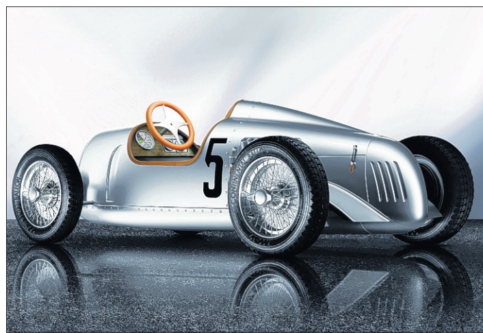
NOSTALGIE Die limitierte Audi-Nostalgie-Edition aus dem Jahr 2007. HO

AUSSTELLUNG Für den Antrieb braucht es Muskelkraft, für den Besitz ein dickes Portemonnaie.